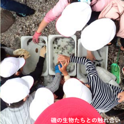
磯の生物たちとの触れ合い