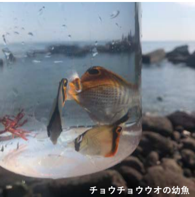
チョウチョウウオの幼魚