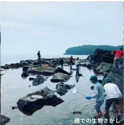
磯での生物さがし