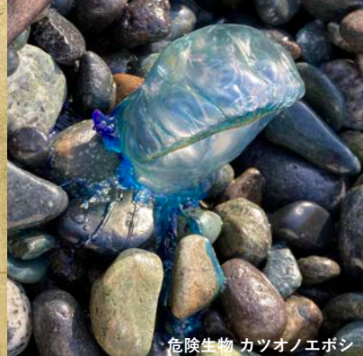
危険生物 カツノエボシ