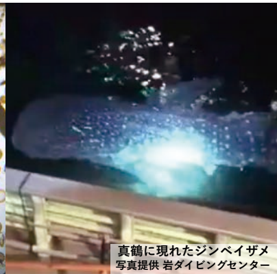
真鶴に現れたジンベイザメ

この度、特定非営利活動法人ディスカバークブルーでは、地域の自然である海を活かした授業やそのアイデアの参考としていただくため、学校の先生向けの研修を開催させていただきます。まずは、先生自身が海の生物との出会いの驚きと喜びを実感してください。